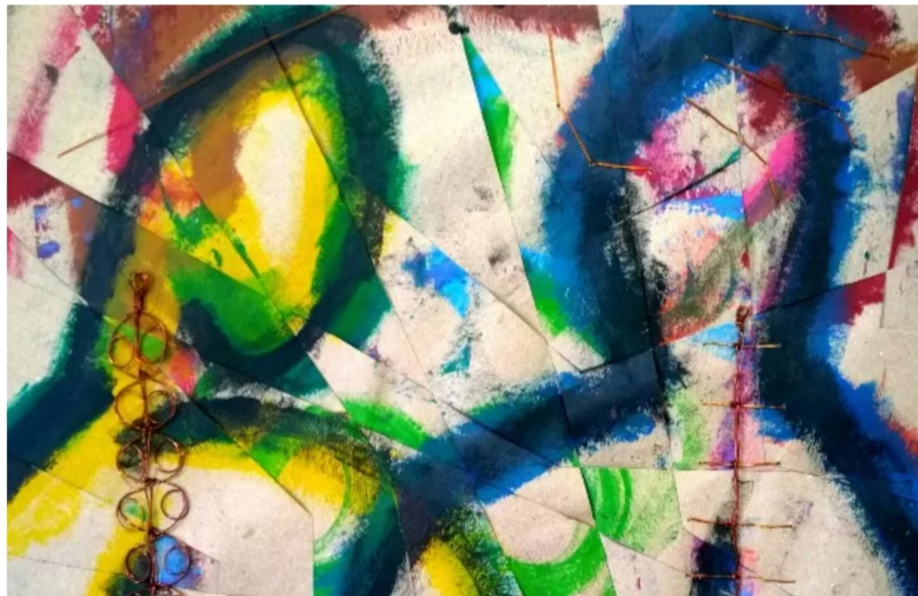
Artista de Goiás é o 1º brasileiro a expor em famosa galeria dos EUA

A exposição segue até o dia 24 de outubro. Depois, ele já tem marcado na agenda viagens para países como Ucrânia e Berlim.